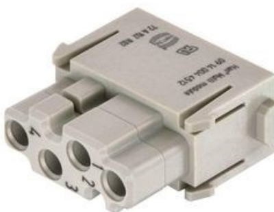
09691815143 - Mixed Contact D-Sub Connectors