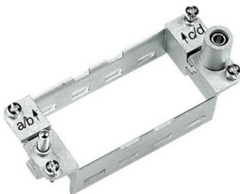
5020.037.238 Průchodka M40/34,5