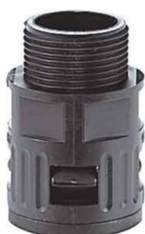
0333.000.040 Ploché těsnění FR-M M40x1,5