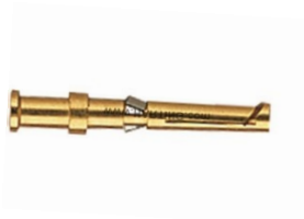
09150006225 Han D F Crimp Contact Au AWG 18